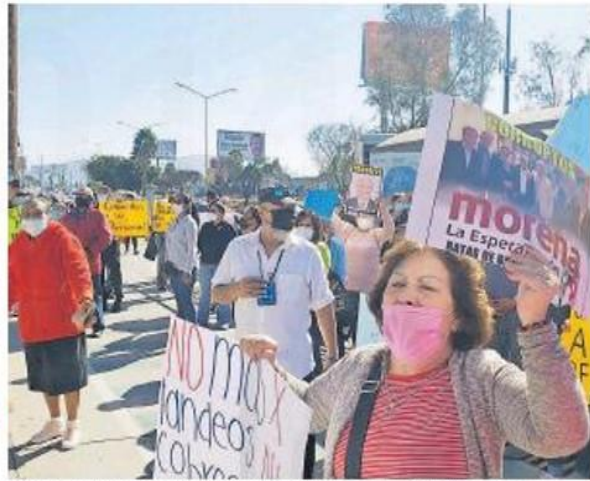
Gritaron consignas como "borrón y cuenta nueva", "no más tandeos"

PARA ESTE miércoles 11 de noviembre, la Comisión del Agua anunciará el nuevo calendario de pausa programada del servicio